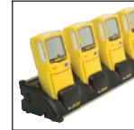
Oplaadapparaat voor meerdere toestellen