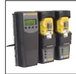
Compatibel met MicroDock II